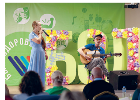
Выступает группа «Романис» Троллейбусного парка № 6 (команда «Витаминка»)

Завершится «Фестиваль талантов» гала-концертом, который состоится 23 августа.